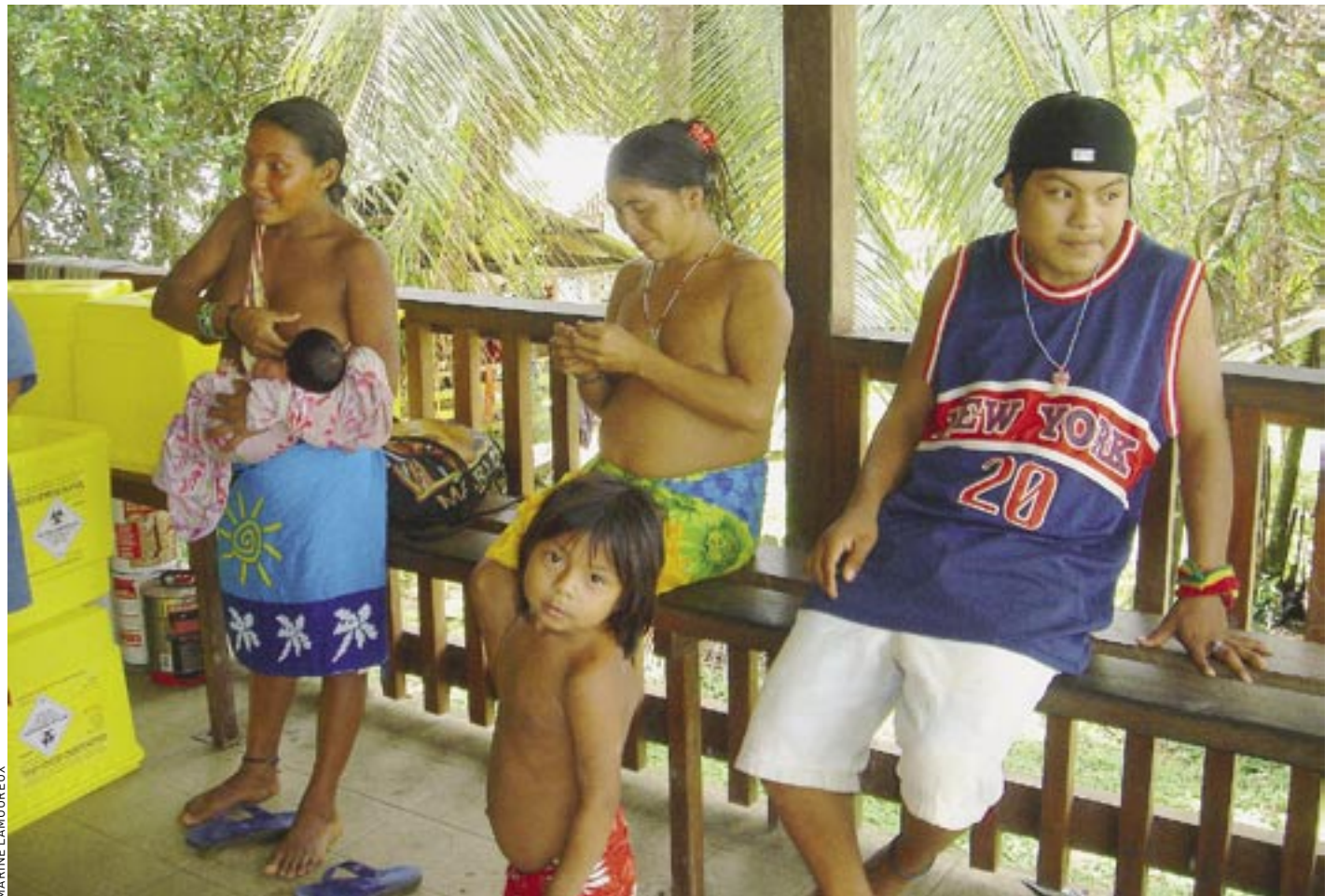
Un jeune du village (à droite) a troqué le kalimbé contre une tenue sportive. Pour certains, la ville offre un mode de vie attractif.

C'est donc en pirogue que les familles partent en expédition de chasse, à quelques heures de navigation du village, dans l'espoir de trouver du beau